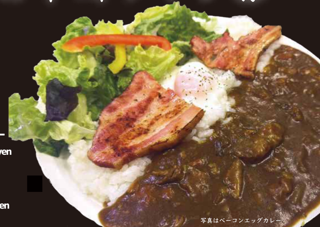
写真はベーコンエッグカレー