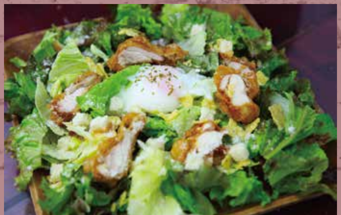
CHICKEN CAESAR SALAD

オールドハンガーサラダ 1050(1155) yen ~濃厚アボカド&シュリンプ~