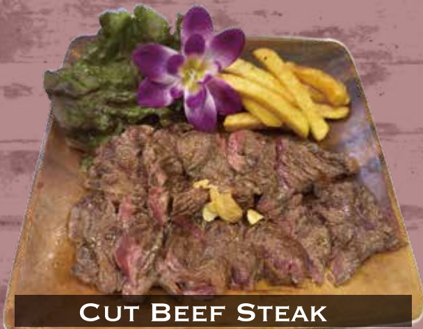
CUT BEEF STEAK