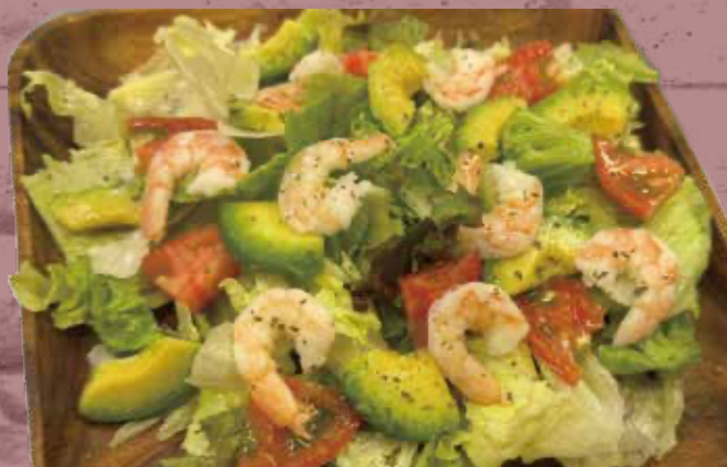
OLD HANGAR SALAD