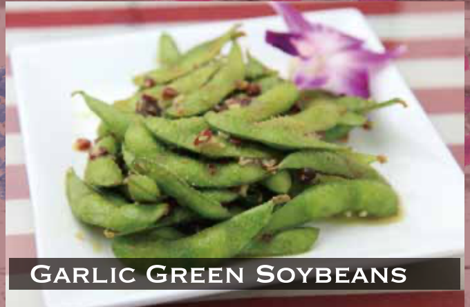
GARLIC GREEN SOYBEANS